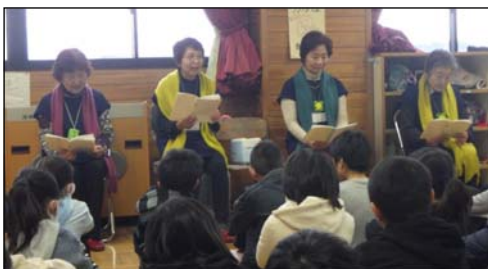
▲ 群読(低・高学年に分けた読み聞かせ)の様子。お揃いのたんぽぽのバッジ、スモック、ストールを身に付け、趣向を凝らした読み聞かせを行っています。

活動を通して、子どもたちの成長を間近で見られるだけでなく、自分たちも本を通して成長できることにやりがいを感じます。