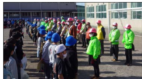
▲ 一斉下校の様子。見守り隊ボランティアの証である蛍光色の帽子と上着を着用し、見回りをしています。

活動を通して、子どもたちと挨拶を交わすことや、子どもたちに安全に対する意識が芽生えてきた姿を見ることにやりがいを感じます。