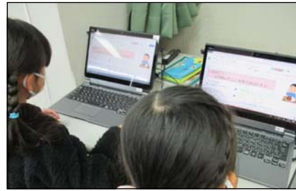
▲ タブレット型パソコンを用いた小学生の授業の様子