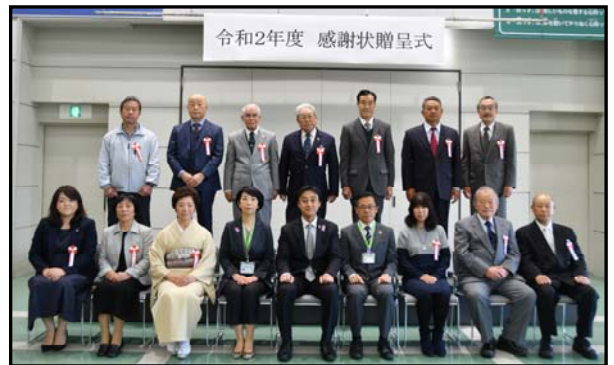
▲令和2年度感謝状贈呈式の様子