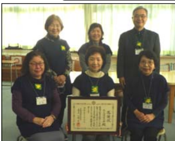
▲ 会のメンバーの皆様