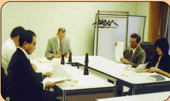
美術館で開催した教育委員会の様子