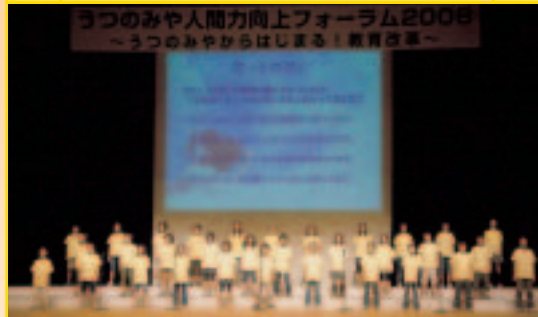
横川東小学校児童