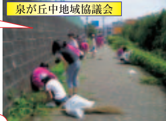
泉が丘地域協議会