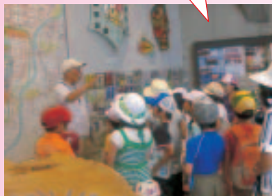
小学校3年生対象の地域から学ぶ校外学習