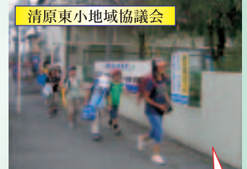
清原東小地域協議会