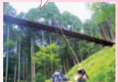
小学校4年生、中学校1年生対象の冒険活動教室

○ボランティアガイド（宇都宮市文化財ボランティア協議会）の方から宇都宮城の話が聞けて、お城に興味を持った。 ○これまであまり知らなかった宇都宮の歴史を知ることができて、ためになった。今度は家族も連れてきたい。