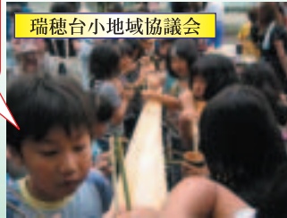
瑞穂台小地域協議会