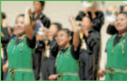
グリーンジュニア マーチングバンド