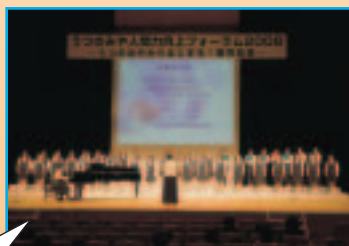
雀宮中学校合唱部

「うつのみやからはじまる！教育改革」を掲げ、子どもからお年寄りまで、宇都宮市に愛着を感じながら、生涯にわたって夢をもち続け、心豊かでたくましく生きるための人間力向上を目指し、盛り沢山の内容で、フォーラムを開催いたしました。未来を担う子どもたちのいきいきとした様子や素晴らしい発言などから、宇都宮の輝かしい未来を切り拓く力を感じました。また、沢山の方のご協力により、大盛況で幕を閉じることができました。今後とも、宇都宮から教育改革を押し進め、心豊かでたくましい宮っこの育成に取り組んでまいります。