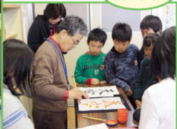
習字ボランティア