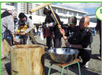
瑞南ふれあい祭り

現在、宇都宮市では多くの地域の方々が、様々な活動を通して子どもとの交流を図っています。このページではそれらの活動の一部をご紹介します。