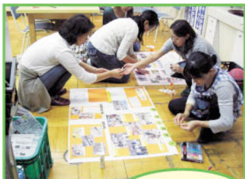
広報用展示パネルの作成