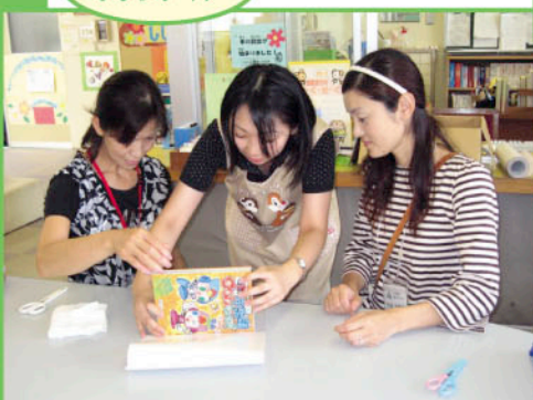
読み聞かせ(やじるべえ)