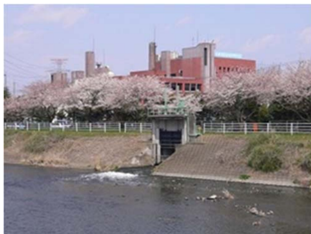
川田水再生センター