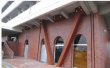
▲耐震化した松田新田浄水場

将来にわたり上下水道を維持するため、災害や事故に強い上下水道施設が必要であることから、耐震化に取り組みます。