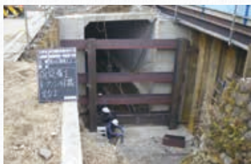
▲雨水管を整備する様子

生活排水を適正に処理し、快適な生活環境を確保するため、老朽化した下水道管の交換に取り組みます。