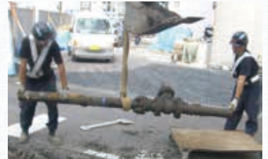
▲水道管を交換する様子

安全でおいしい水道水を提供するため、水道管の漏水箇所の調査・修繕や老朽化した水道管の交換に取り組みます。