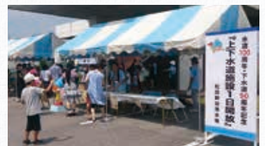
▲水道100周年・下水道50周年記念「上下水道施設1日開放」の様子

水道100周年・下水道50周年という節目に、様々な記念イベントを通し、事業に対する理解や関心をより一層深めていただく取り組みを実施します。