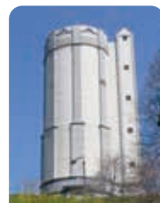
中心部 戸祭配水場