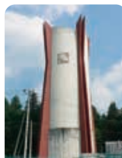
西部地区 下荒針配水場