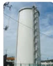
南部地区 瑞穂野応急給水所