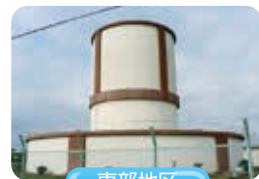
東部地区 板戸配水場