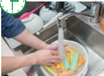
1日で使用した器具を洗浄します。