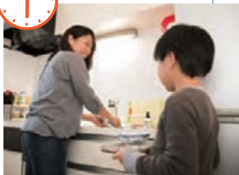
夕食の支度と夕食後の食器洗い。