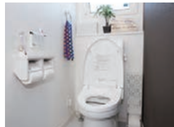
トイレは1日に何回も使います。