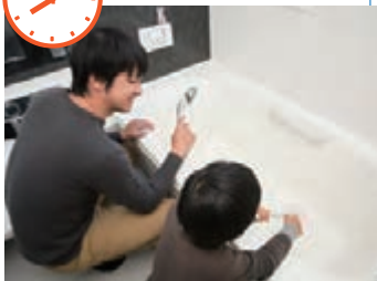
夕食後お風呂タイム。