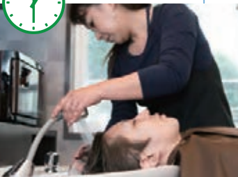
シャンプーは1日に何回も行います。