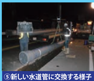
⑤新しい水道管に交換する様子