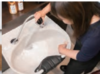
閉店後にシャンプー台を洗います。