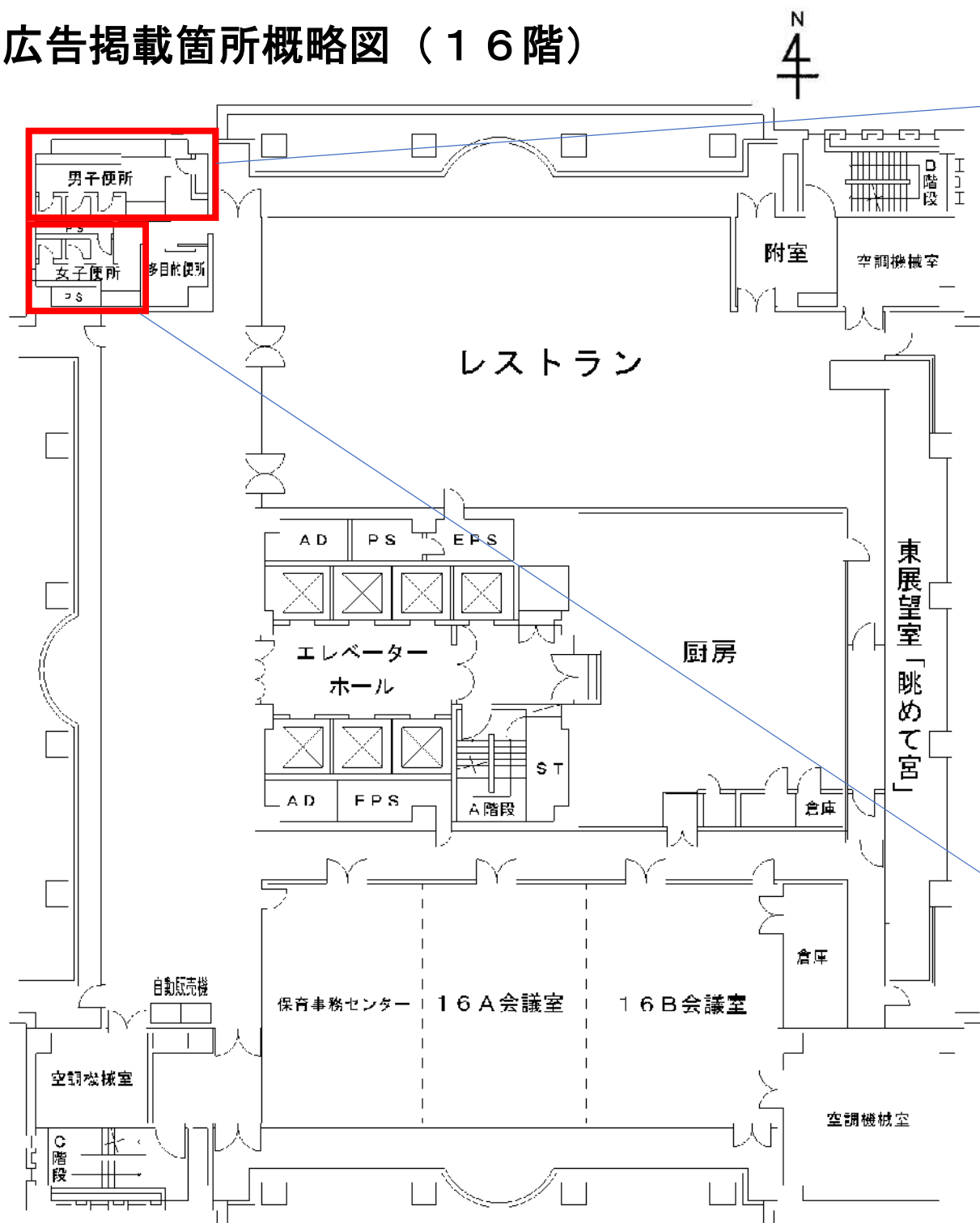
⑥ 16階男性用トイレ内