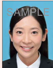
平常の顔貌と著しく異なるもの(口角が上がるなど)