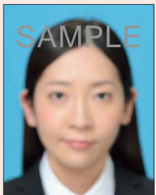
ピンぼけや手ぶれにより不鮮明なもの

撮影時にピントが合っていないかったり、手ぶれしてしまったため画像が不鮮明なもの、顔にてかりやムラがあるものは不適当です。