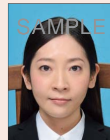
背景以外のものが写り込んでいるもの