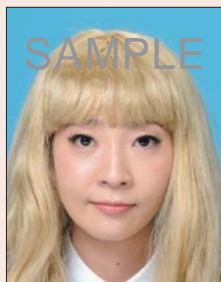
実際の容姿と著しく異なるもの(ウィッグなど)