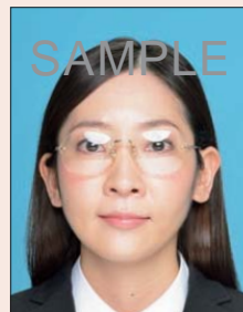
照明が眼鏡に反射したもの