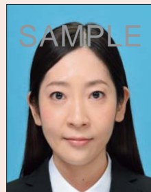
変形やマスクなどの画像処理をほどこしたもの