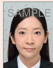
背景に柄があるもの