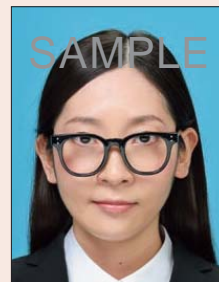
眼鏡のフレームが目にかかっているもの