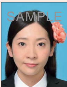
顔や頭の器官が隠れる装飾品などがあるもの