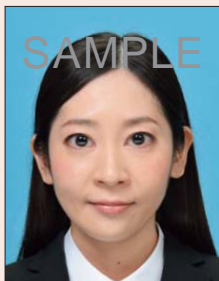
目を大きくしたり、顔のパーツが変形したもの

目を大きく見せたり、美白処理、顔パーツやほくろなどを修正するなどして、本人のイメージを変えることは、いかなる場合も不適当です。