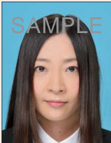
顔の輪郭が隠れるもの