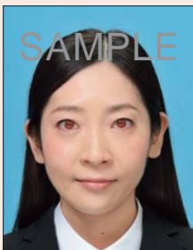
フラッシュなどにより瞳が赤く写ったもの