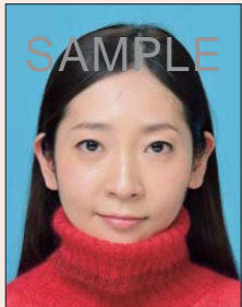
衣服などにより顎などの顔の一部が隠れているもの