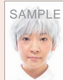
人物と背景の境界が不明瞭なもの