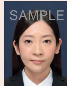
背景の色が濃いもの