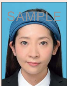
帽子や幅の広いヘアバンドにより頭部が隠れているもの