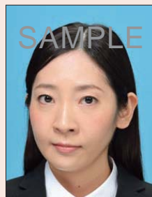
横を向いているもの