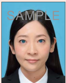
カラーコンタクトを装着したもの

カラーコンタクトを装着したものとフラッシュなどの影響により瞳が赤く写ったものは不適当です。黒目に照明が反射したキャッチライトは問題ありません。