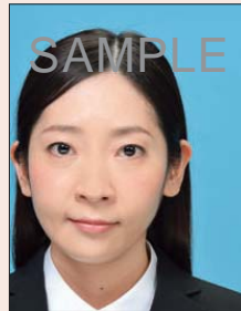
位置が片寄っているもの