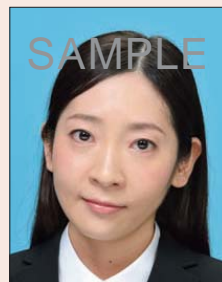
左右に傾いているもの