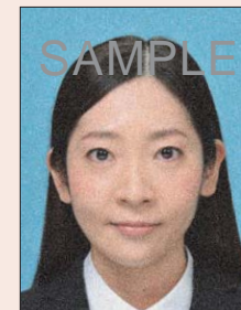
ドットやインクのにじみがあるもの