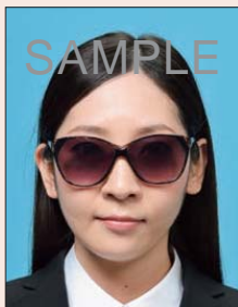
色付きの眼鏡やサングラス

色付きのレンズや反射・影があるものは不適当です。また、目を妨げる縁・フレームがないものに限ります。医療上必要とされない限り、サングラスや処方のない色付きの眼鏡は許可されません。