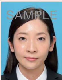
てかりやムラがあるもの