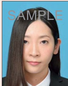
髪が目(黒目)にかかっているもの