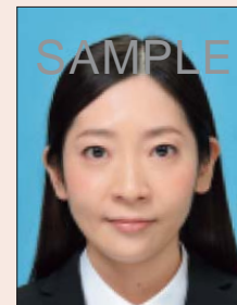
ジャギーがあるもの