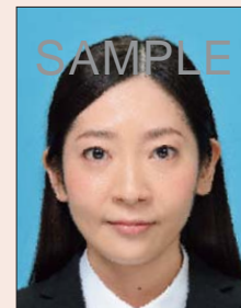
ノイズがあるもの

デジタル画像の過剰な圧縮などが原因となってノイズ(画像の乱れ)が発生しているものや、ジャギー(階段状のギザギザ模様)、印刷時のドット(網状の点)やインクのにじみがあるものは不適当です。写真専用の用紙を使用し、鮮明な画質で印刷してください。