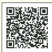
宇都宮市HP(宇都宮市AED貸出制度)