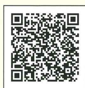
宇都宮まちかど情報マップ