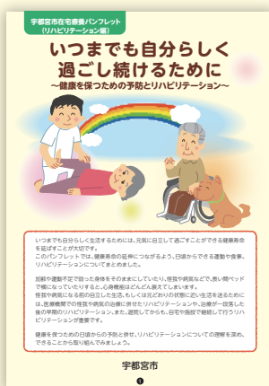
● リハビリテーション編