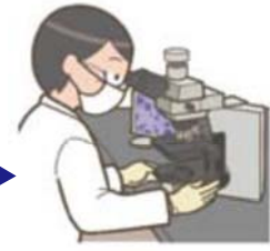
宇都宮市 衛生環境試験所