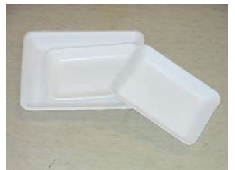
고기나 생선, 반찬 등에 사용되는, 색이나 무늬가 없는 하얀색 식품 접시