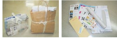
잡지류나 서적 종이상자나 봉투 등의 종이류

○잡지는 끈을 이용하여 열십자로 묶어 주십시오 기타 종이는 필름 등의 이물질을 제거, 종이 봉투에 넣어서 열십자로 묶거나 투명 또는 반투명 비닐 봉지에 넣어 주십시오.