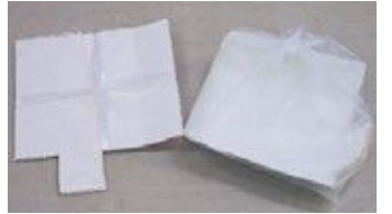
우유나 음료수 등 안쪽이 하얀 종이 팩

○가볍게 행귀서 펼친 후, 말려서 열십자로 묶거나 투명 또는 반투명 비닐 봉지에 넣어 주십시오. ○플라스틱으로 된 주둥이는 제거해 주십시오.