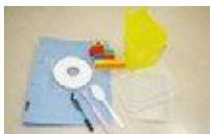
플라스틱으로 된 상품