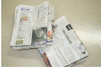
신문 (전단지 포함)