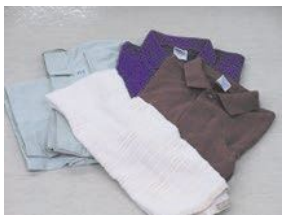
셔츠 등의 의류나 수건 등의 헝겂류

○잘 빨아서 접은 후, 투명 또는 반투명 비닐 봉지에 넣어 주십시오. ○젖은 것은 보관고에서 곰팡이가 생길 우려가 있습니다. 비가 오는 날에는 배출하지 말아 주십시오.