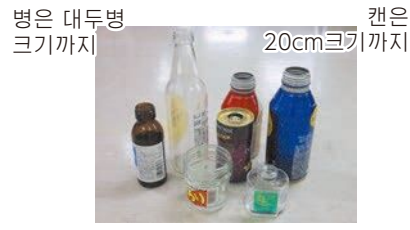
음료수병, 식료품병, 약병, 캔류 화장품 병

○뚜껑을 제거하고 행군 후, 병과 캔은 함께 투명 또는 반투명 비닐 봉지에 넣어 주십시오. 깨진 병도 배출가능 합니다.