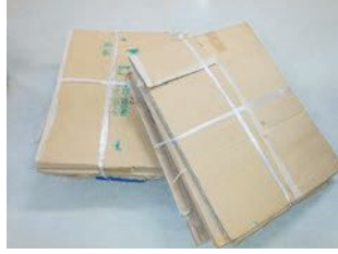
골판지 상자 (단면이 물결 모양인 것)

○박스테이프 등의 이물질 제거하고, 접어서, 한장이라 하더라도 끈을 이용, 열십자로 묶어 주십시오.