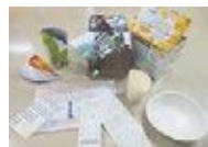
재생 불가능한 종이 가지치기한 나뭇가지 등 (방수종이나 감열지 등)