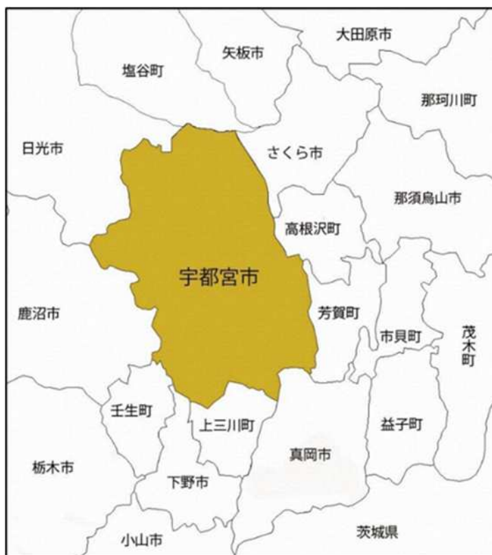
図1-3 宇都宮市の位置

市域は、東西約24km、南北約30km、総面積は416.85km 2 であり、北は日光市、塩谷町、さくら市、東は高根沢町、芳賀町、南は真岡市、下野市、上三川町、壬生町、西は鹿沼市と接しています。