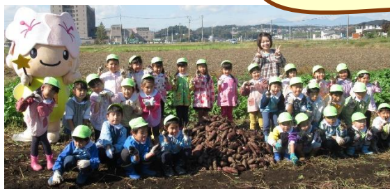
サツマイモの収穫