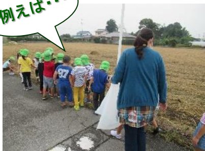
園周辺のごみ拾い