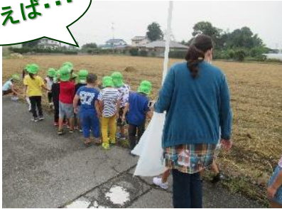
園周辺のごみ拾い