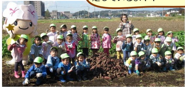
サツマイモの収穫