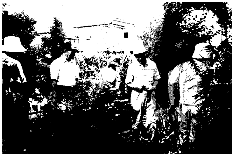
●緑化ボランティアなどを育てる講習会の実施風景

地域ぐるみの環境活動などを通して、地域住民一人ひとりの環境意識を育て、地域から行動していく実践力を培っていく役割が期待されます。