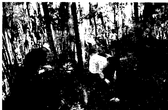
●ボランティアによる樹林地の保全活動の様子