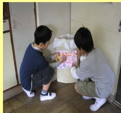
西小学校環境 ISO 掲示板