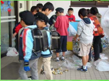
毎月2回4日間アルミ缶を回収しています。