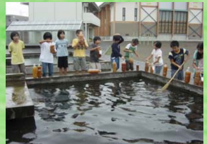
観察池にEM菌をまいて定着させようとしているところです。