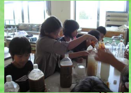
4年の総合的な学習の時間に米のとぎ汁からEM菌を作りました。

4年生の総合的な学習の時間では「身近な環境は、今」というテーマで、学習を進めています。自分たちで米のとぎ汁からEM菌を作り、学校の観察池にまいています。EM菌が池に定着すると、濁っていた池が透明になっていきました。