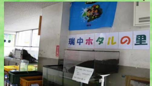
校内のホタル水槽