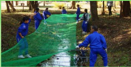
「みずほの自然の森公園」での落ち葉防止ネットの設置

かつての瑞穂野地区には、数え切れないほどのホタルが舞っていたそうです。環境の変化によって激減してしまったホタルを復活させようとする取り組みを地域ぐるみで行っています。瑞穂野中学校では、江川の