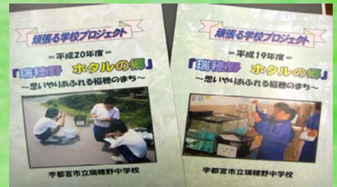
『頑張る学校プロジェクト』 作品集