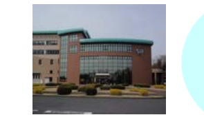
宇都宮市環境学習センター