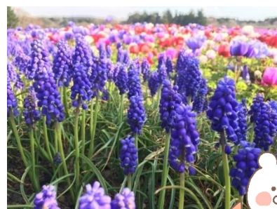
写真はイメージです ムスカリとチューリップで いっぱいのお花壇。