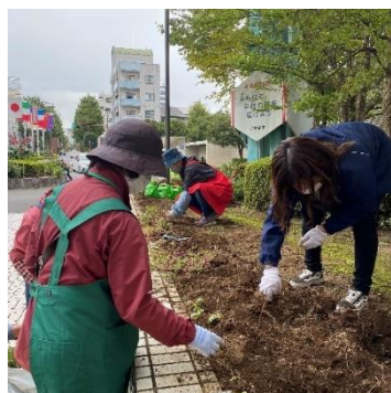
おつかれさまでした。