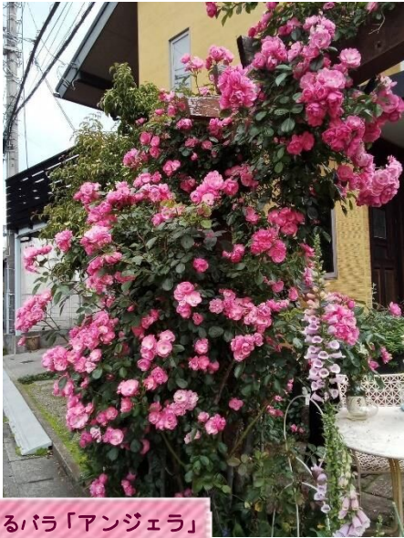
つるバラ「アンジェラ」

今年は花の開花が早く、5月中旬にはバラが咲き始めた ようで、さっそくボランティア3人で伺いました。