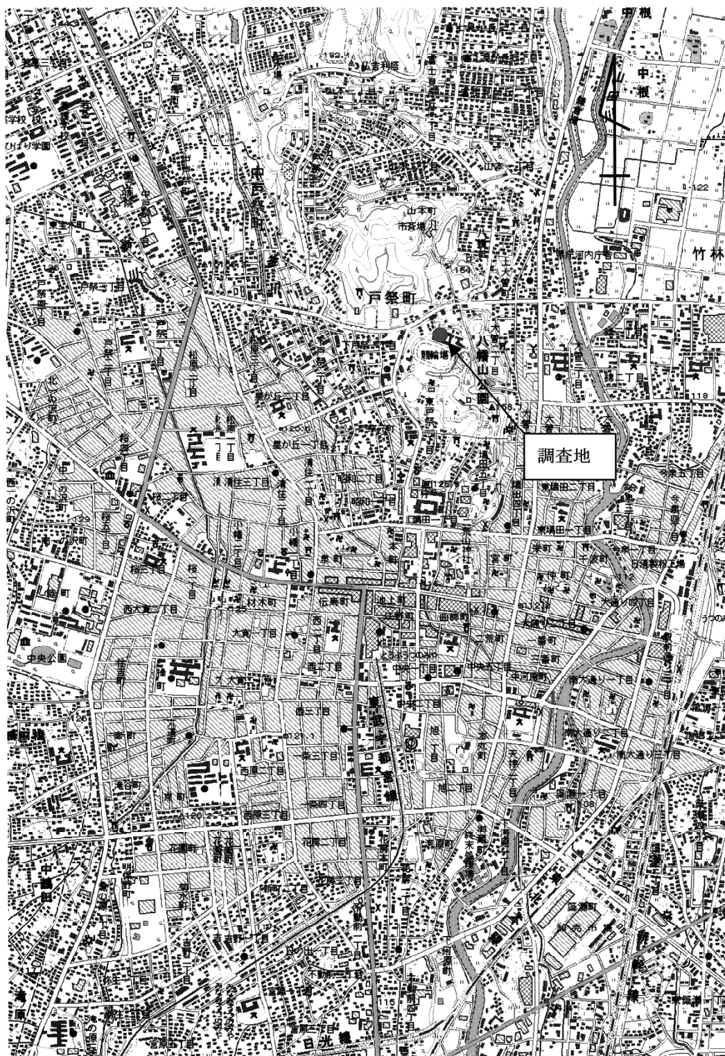
図 2-1.調査地案内図 S=1/25000