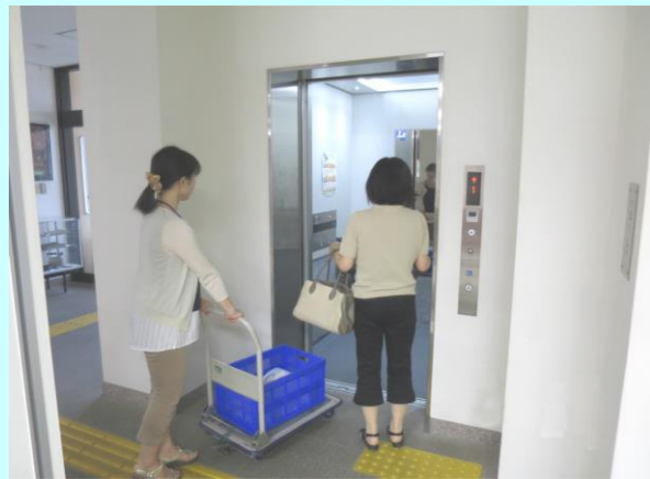
提案事業: 雀宮地区市民センター改修事業