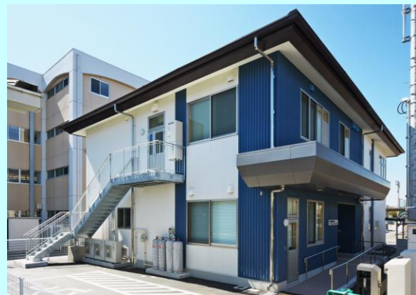
高次都市施設: 五代若松原地域コミュニティセン