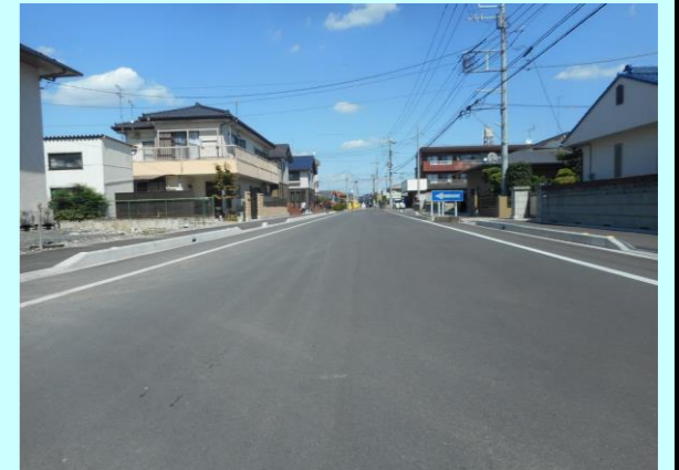
道路事業: 市道704号線