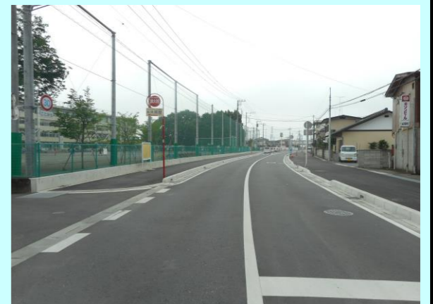
道路事業: 市道713号線

まちの課題の変化 ・地区住民の生活や生涯学習の活動を支える基盤の整備により、本市南部の地域の核となる拠点エリアが形成されたことから、一層の利便性向上や施設の利用促進を図る必要がある。 ・五代若松原地域コミュニティセンターの整備や、雀宮地区市民センターのバリアフリー化等を実施したことにより、地域の活動拠点の利便性や安全性の向上が図られたことから、今後は、地域活動の一層の活性化や住民間の交流を支援していく必要がある。 ・雀宮駅周辺地区の道路整備において、地区の東西を結ぶ市道713号線が完了し、そのほか、国道4号や県道雀宮停車場線などの道路整備が着実に進捗しており、事業中の市道704号線を早期に完了させ、雀宮駅へのアクセス性や交通安全性・快適性の向上を図る必要がある。