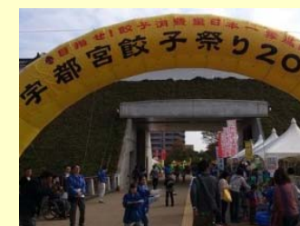
宇都宮餃子祭り 平成25年来訪者数 約14万2,000人