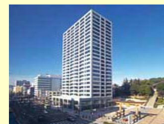
コンベンション 平成25年度 開催数約107件