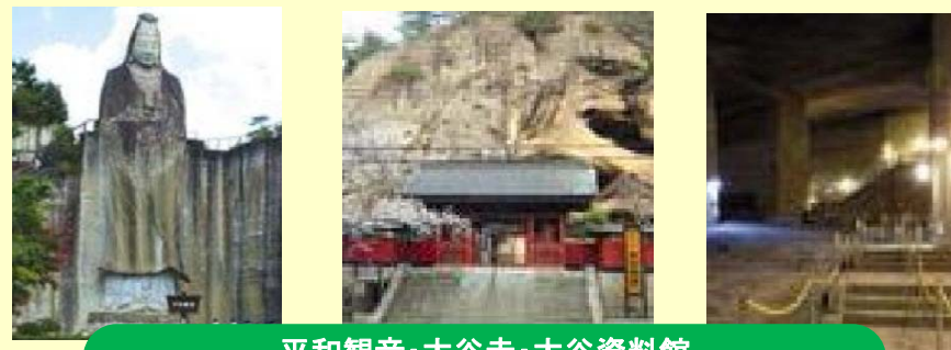
平和観音・大谷寺・大谷資料館 平成25年来訪者数 約25万7,000人