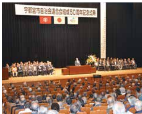
▲市自治会連合会結成50周年を記念して式典を開催しました。多くの自治会関係者に集まっていただき、改めて自治会の大切さを再確認しました。

また、もし、大きな災害が起きてしまった時、地域でうまく協力し合って命を守ることはできるでしょうか。災害発生時の後は、自