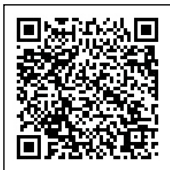
▲QRコード ※一部の機種で表示されない場合があります。

考えていたのだと思います。そして、自分の住んでいる地域について、どのようにしたら皆が安全で安心して、住みやすいまちになるのか考えていただき、地域に愛着を持ってほしいと願っています。 今年、結成50周年を迎える市自治会連合会でも、「絆と共助で築こう みんなの自治会」をスローガンに掲げ、新たにシンボルマークも作り、本市のよりよい自治会運営のため、これからも尽力していきたいと思っています。