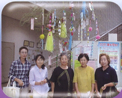
ふれあいいきいきサロン 瑞穂台の皆様