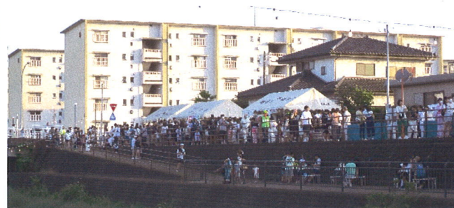
自治会・PTA主催の模擬店には行列ができました

「子どもみこし」をはじめに、夜の「打ち上げ花火」まで、約2,000人が久しぶりのお祭りを楽しみました。