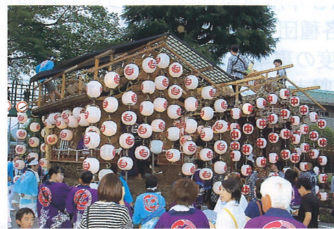
写真 令和元年 増淵東平さん提供