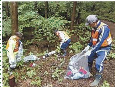
6月16日不法投棄監視パトロール 自治会長、リサイクル推進員が3班に分かれて、地区内の投棄物を収集しました。