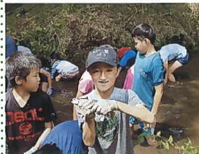
8月18日マスのつかみどり 今年は山王団地の子どもたちも参加し、参加者が昨年を上回る265名となりました。