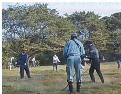
8月17日二宮堰公園整備 早朝から、環境部会員、自治会長、育成会の皆さんが、草刈り、用水路整備を行いました。