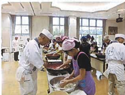
6月9日家庭教育学級 21組の親子がそば打ちに挑戦し、できあがったそばをおいしくいただきました。