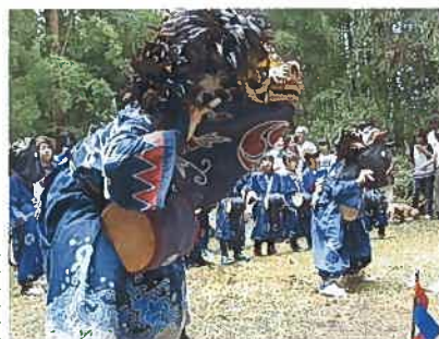
8月15日上横倉獅子舞 多藤神社の境内で獅子舞が行われました。子どもたちも練習の成果を発揮し見事に演じました。