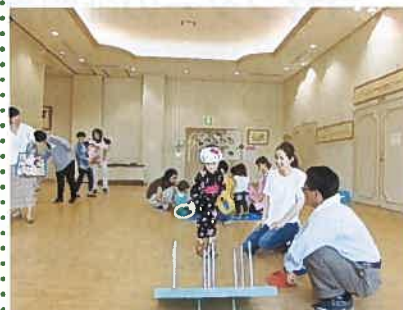
7月29日ママたち広場 この日は「縁日ごっこ」。楽しいお店がいっぱい！親子で楽しみました。