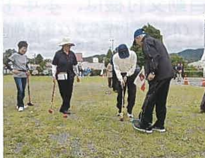
7月7日球技大会 総合成績は、優勝 下町、準優勝 東部、3位 西部でした。暑さの中、お疲れ様でした。