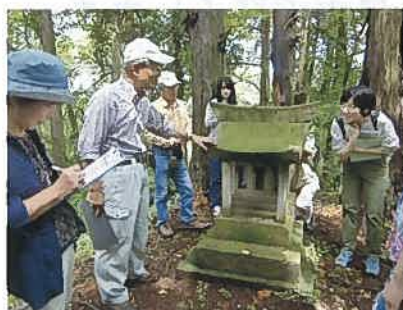
6月22日富屋の自然・歴史・文化財ガイド養成講座 この日は、現地に出向いて、史跡の見学をしました。