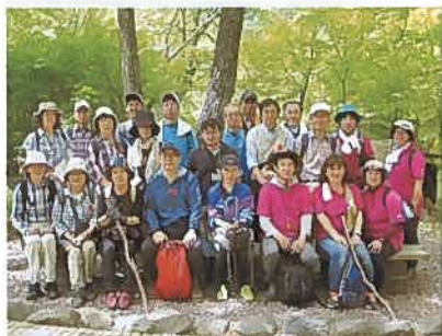
5月19日健康づくりハイキング 天候にも恵まれ、参加者27名が新緑の塩原溪谷遊歩道を楽しく散策しました。