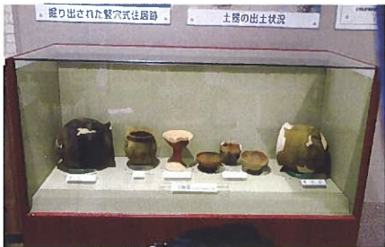
北若松原遺跡出土品

これらの遺跡や古墳からは、円筒埴輪を始め縄文土器、土師器、須恵器等の土器や、曲玉、矢じり、石斧等が広く出土している。