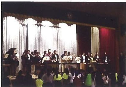
五代っ子フェスタ

地域協議会の方々と子供たちが触れ合うことのできるお祭りです。地域の様々な活動団体が日頃の練習の成果を披露してくださったり、ゲームを一緒に楽しんだりしています。今年は12月7日(土)に行われる予定です。