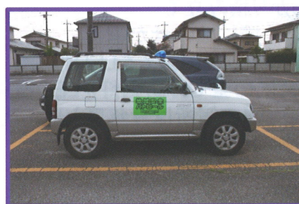
青色パトロールカー