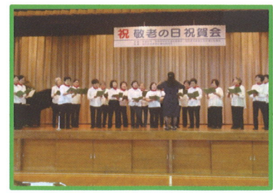
コーラス『ひばり』のみなさん