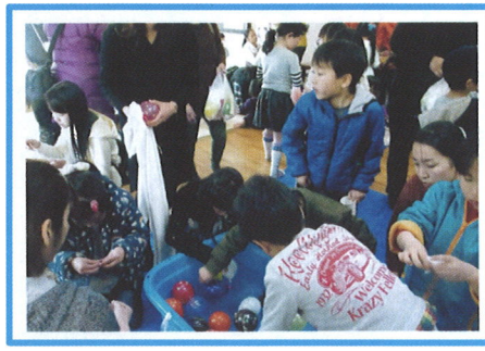
若松原二丁目のつどい