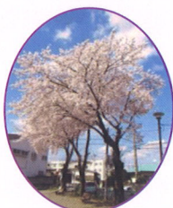
五代2 西田1号児童公園