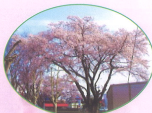
みどり野 ふれあい公園