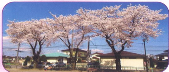
五代2 西田1号児童公園