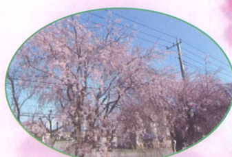
バス停 みどり野町中