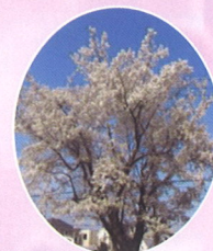
北若 ヨークバニマル