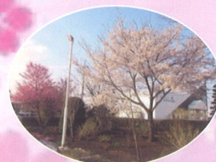
北若 ヨークバニマル