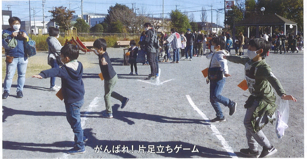
がんばれ! 片足立ちゲーム