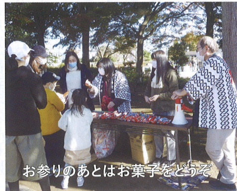
お参りのあとはお菓子をどうぞ