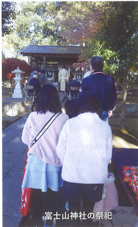
富士山神社の祭礼