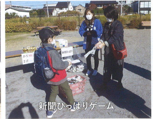
新聞ひっぱりゲーム