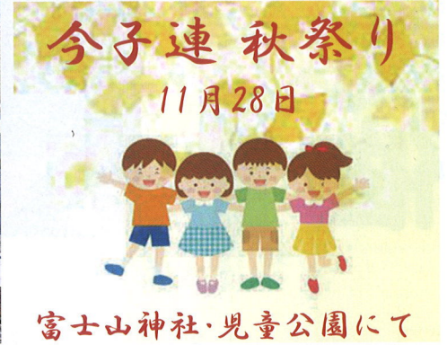
富士山神社・児童公園にて