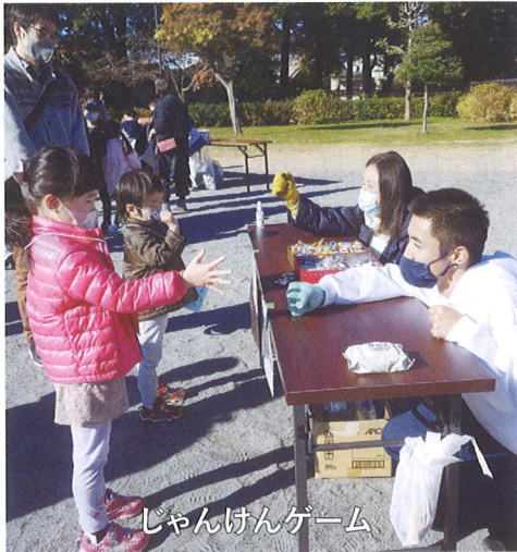
じゃんけんゲーム