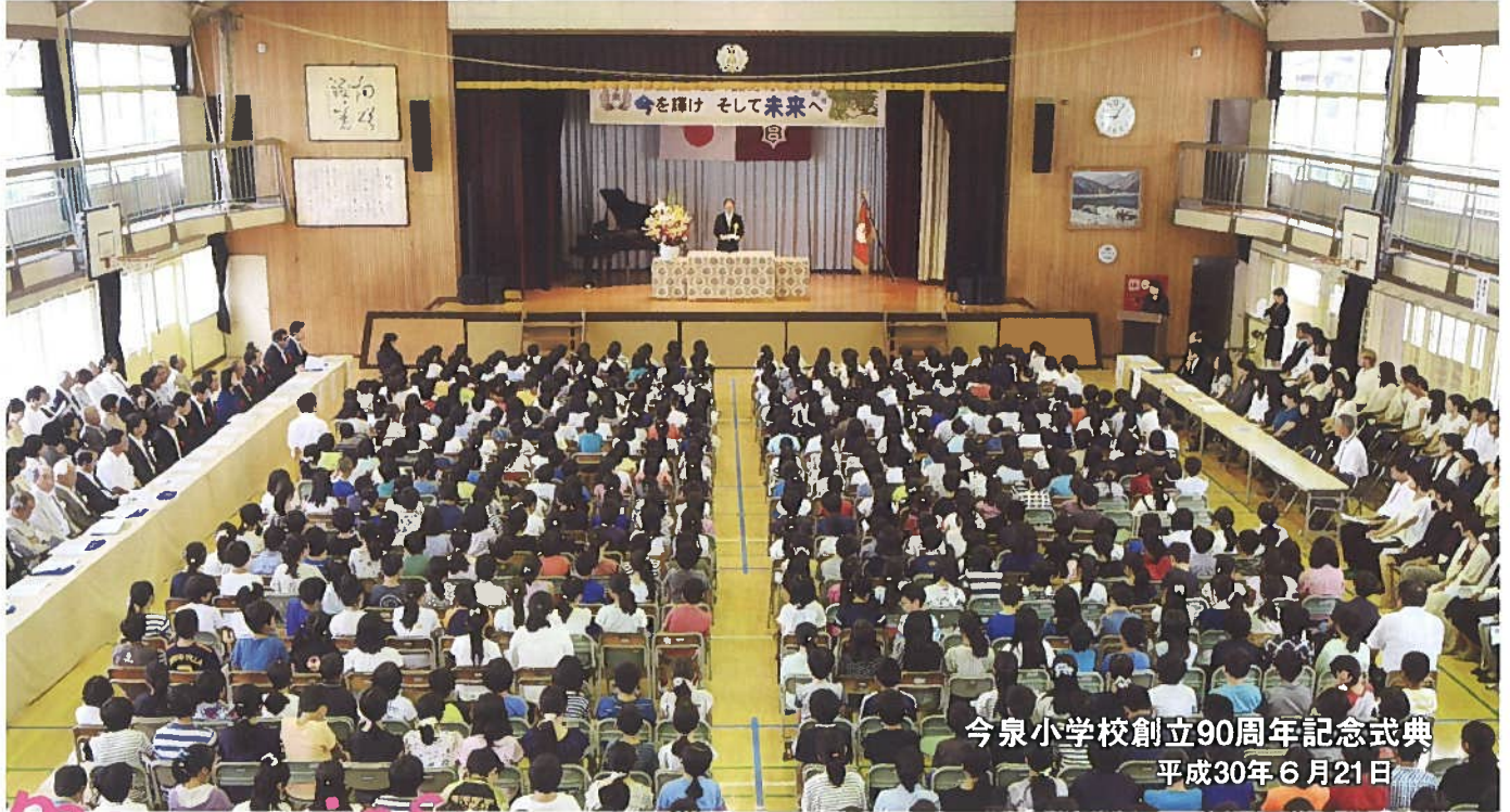
今泉小学校創立90周年記念式典 平成30年6月21日