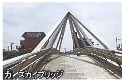
カ イスカイブリッジ