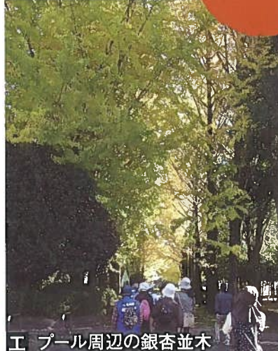
エ プール周辺の銀杏並木