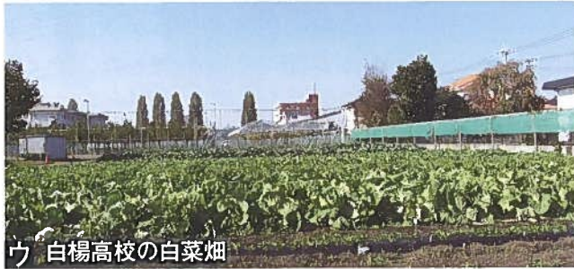
ウ 白楊高校の白菜畑

『今泉地域の史跡と文化財』 (2010年社会委員会編集) を元に作成しました。地図には 今泉地区外も含まれます。