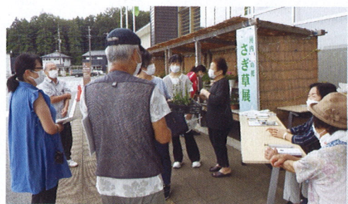
上: 展示会・8月1日～6日 下: サギソウ朝市・8月6日

河内地区のシンボルフラワー「サギソウ」を通して、花の特徴などを語り合う楽しい展示会でした。