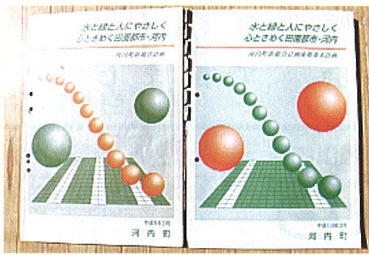
河内町新総合計画 後期基本計画 (平成8年度〜平成17年度)