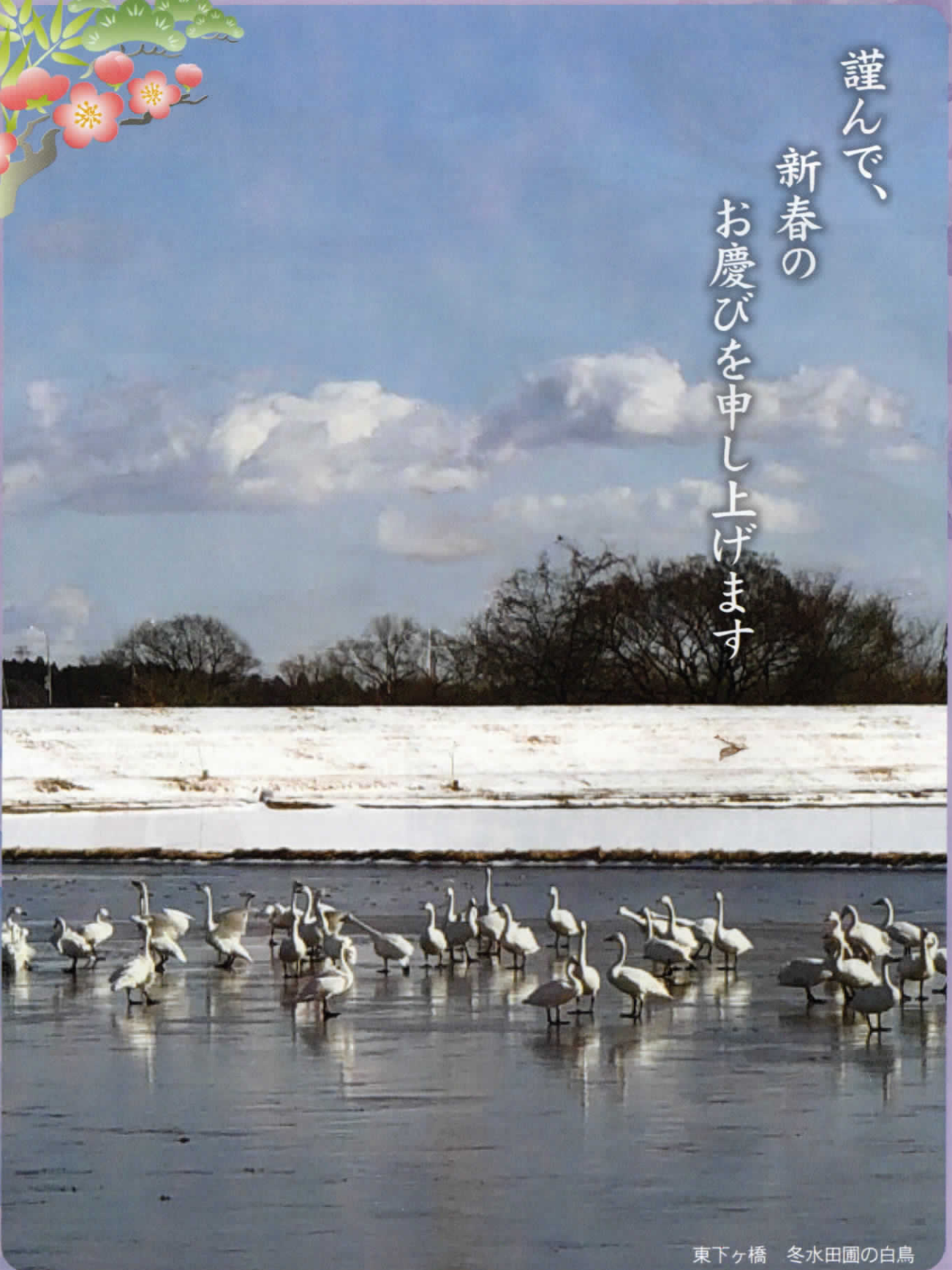
東下ヶ橋 冬水田圃の白鳥