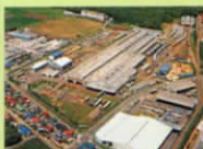
汽車製造(株)【昭和40年航空写真】

当初、従業員200名ほど始まった汽車製造(株)宇都宮工場は、川崎重工(株)の国鉄の貨物車両工場にかわり、1987年生産車両もバスに代わり、名称もIKコーチ(株)になり、さらにバス製造(株)、また2004年には日野車体工業と統合し、ジェイ・バス(株)名称が代わり現在に至ります。現在では従業員数が900名になり、今年の8月から車型が増え、連節バスも製造するようになりました。