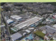
ジェイ・バス(株)【平成30年航空写真】

生産台数もIKコーチの800台強から1800台(2019年度)になり生産能力も約2倍強となっております。名前・生産車両を変えながら河内と共に成長をしております。これも一重に、河内地域の住民の皆様方のご協力ご支援のおかげと思っております。