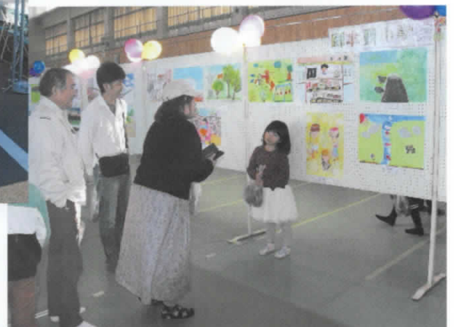
小学生が描いた「ふるさと かわち」