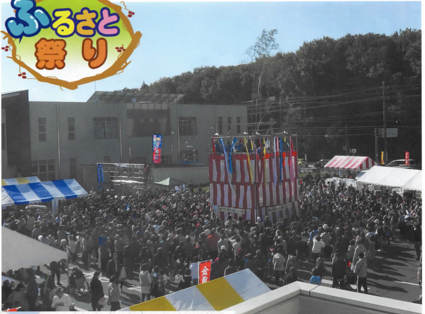
11月10日(日)2万3千人が来場