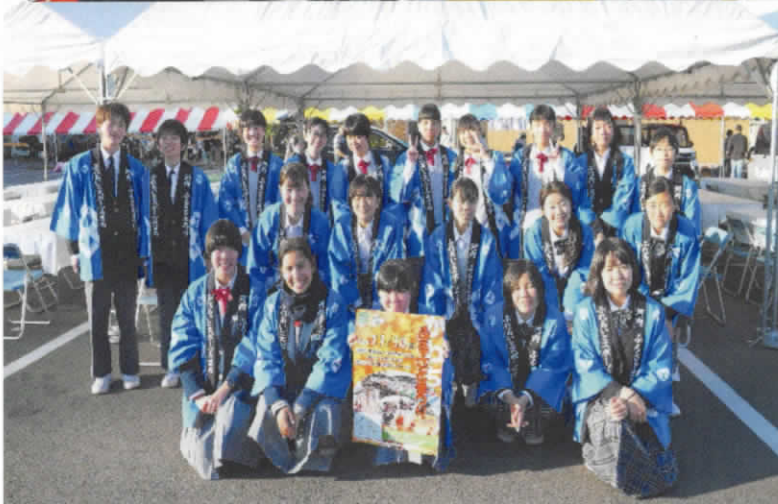
中学生ボランティアの面々