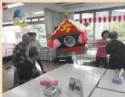
手作りのおみこしで夏祭り

また、利用者様が画用紙を一つ一つ丸めて創作したデイサービス自慢の「富士山」は、季節ごとに景色が変わりとても綺麗です。地域の皆様ぜひ見に来てください。