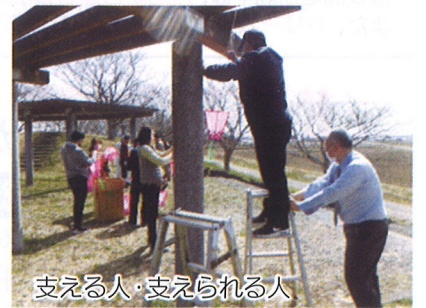
支える人・支えられる人

その一環として、多くの人数が参加する花見会(4月2~3日)は出来なくても、せめて地域の人たちが晴天の下、桜とともに年度初めの日々を楽しんでいただきたいとの思いから、ボンボリを3月25日~4月11日まで設置しました。