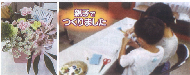
親子で つくりました