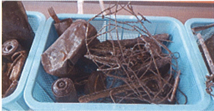
混入している危険物(3階に展示)

現在、クリーンパーク茂原では、10月下旬からのごみ搬入再開に向けた施設復旧に取り組むとともに、市民の皆様へ燃えるごみの5割削減をお願い