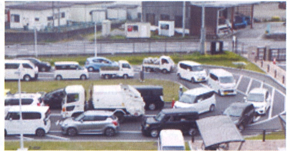
下田原クリーンセンターの混雑状況

なお、本市では、当施設の見学のほか、ごみの分別講習会の開催が可能です。ご希望の方は下記まで事前にお問い合わせください。