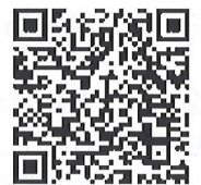
岡本小学校 夏まつり花火