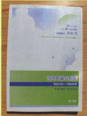
河内町総合計画 (平成18年度〜平成27年度)