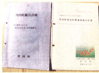
河内町総合計画 後期基本計画 (昭和61年度〜平成7年度)