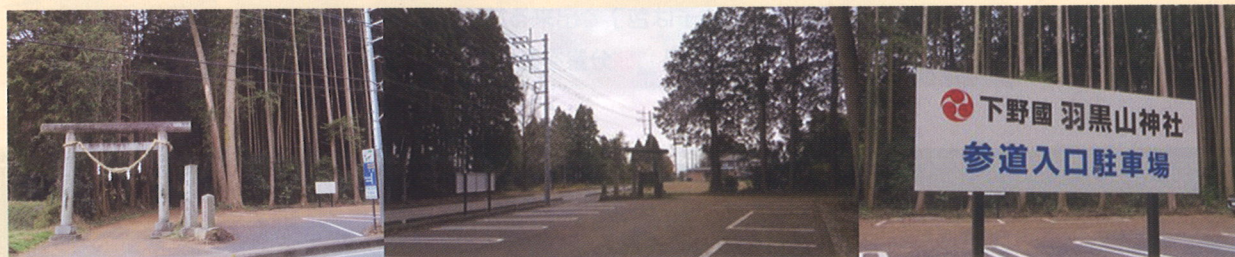
羽黒山神社参道入り口に駐車場14台分が完備されました。参拝・ハイキングにぜひご利用ください。

編集後記 新年おめでとうございます。 2年続きのコロナ災害も落ち着くような気配でしたが、師走からオミクロン株が現れて、これからの冬場の感染拡大が心配です。感染対策をきちんと、うつつさない、うつらない、に徹しましょう。 さて、今年の干支は寅です。寅とは動物のトビです。虎は千里行って千里帰るといわれるように、寅年の人は、勢いが盛ん。正義感が強い。逆境にあっても立ち向かう強さを持っているといわれています。この勢いで今年も頑張ります。応援をお願いします。 年はじめ早々ですが「防災のはなし」を計画しました。身近なことでするので、参加をお待ちしています。