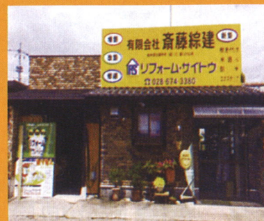
栃木県知事許可 [般-27] 第10752号