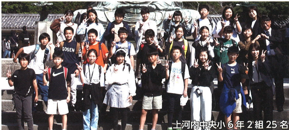
上河内中央小6年2組 25名