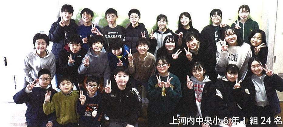
上河内中央小6年1組 24名