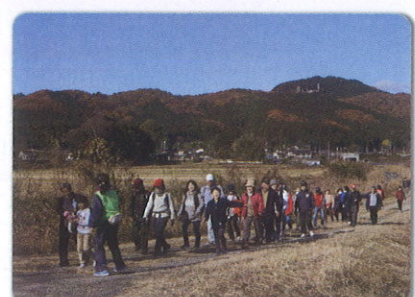
羽黒山ウオーキング大会