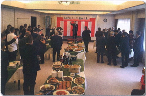
地域の発展に乾杯