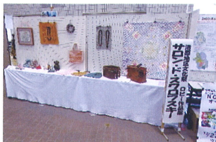
サロン・ド・スワロフスキー