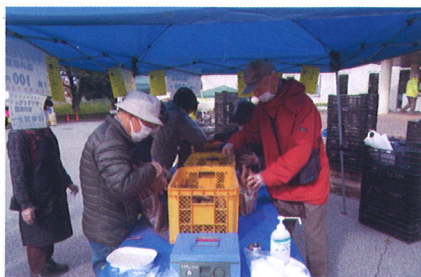
農業祭野菜の詰め放題