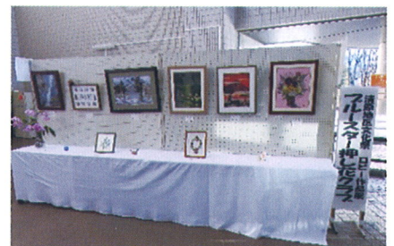
ブルースター押し花クラブ