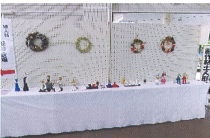
創作粘土人形クラブ