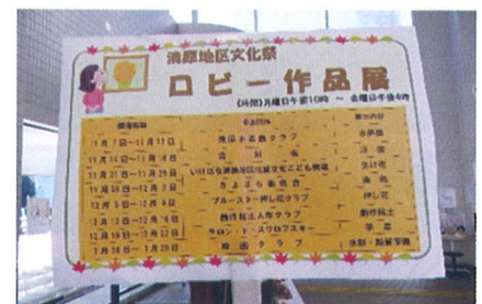
作品展示参加団体一覧