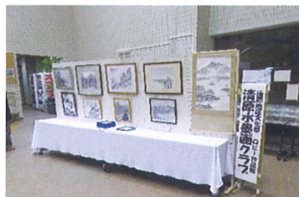
清原水墨区クラブ