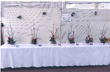
いけばな清原地区伝統文化こども教室