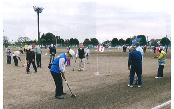
グラウンドゴルフ大会の様子

そのような中で、女子バレーボールが優勝、軟式野球、卓球が準優勝、ソフトテニス第3位という素晴らしい成績となり、選手の皆さんは大いに健闘して下さいました。お疲れ様でした。