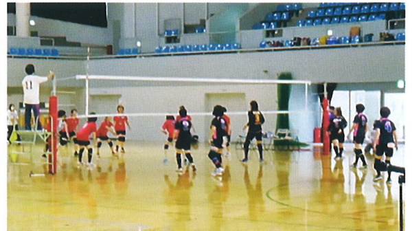
簡易バレーボール試合風景