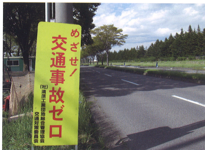
交通安全訴求看板設置