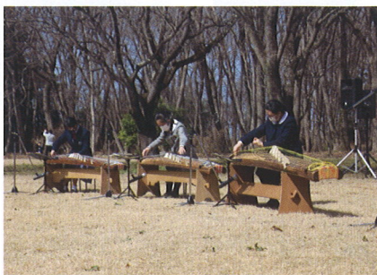
宇都宮海星女子高等学校箏曲演奏