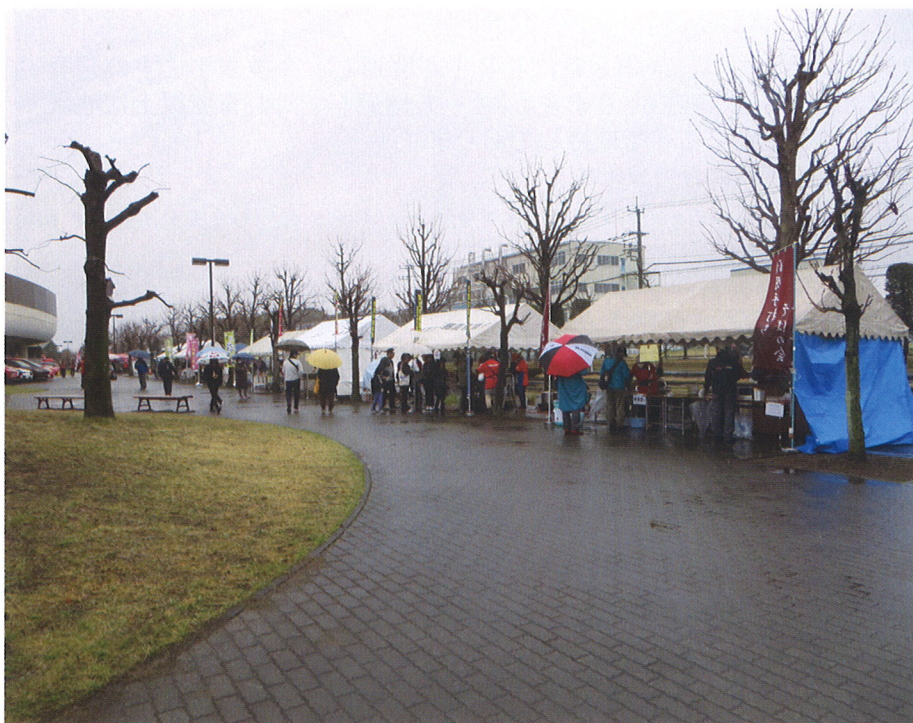
おもてなし出店風景

そうした中、清原おもてなし事業の一環として、ご当地の特色を生かした7店舗が出店し、来場者に提供しました。特に、「清原だいちのキムチ」のPR活動として、試食とアンケートによる聞き取り及び希望者への販売を行いました。