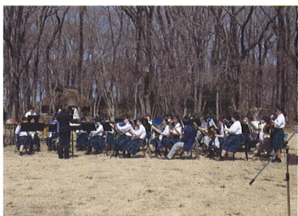
清原中学校・清陵高等学校 吹奏楽演奏