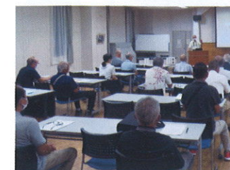
自然環境保全講演会

清原中学校地域未来会議 今回で3回目となる清原中学校生徒会による「地域未来会議」に、環境保全委員4名が出席しました。今年度はLRTや清原中学校75周年記念式典、清原地区の今後の展望などを3グループに分かれて話し合う中で、様々な意見が出されました。