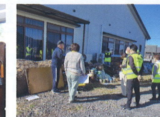
不法投棄パトロール