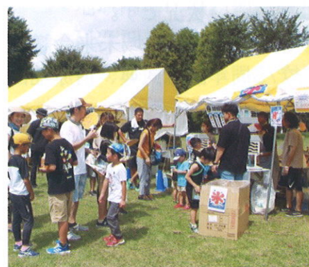
まんぷくフードフェスタ