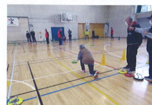
カローリング大会