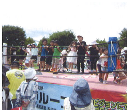
プロレス特設ステージ