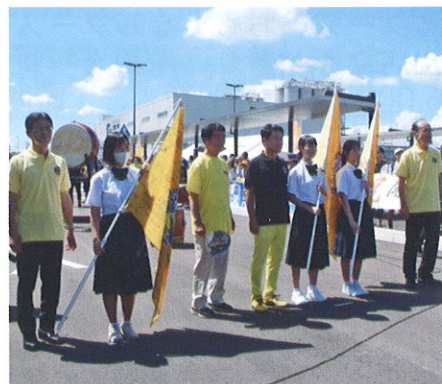
市長等から清原中学校生徒への フラッグ授与式