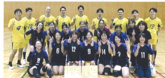
優勝の男子、女子バレーメンバー

9月17日よりスタートした大会でしたが、清原地区は優勝地区に1点差にまで迫る総合準優勝でした。軟式野球と男子及び女子のバレーボールが優勝、ゴルフが準優勝、その他の競技種目も大健闘でした。選手の皆さん本当にお疲れ様でした。