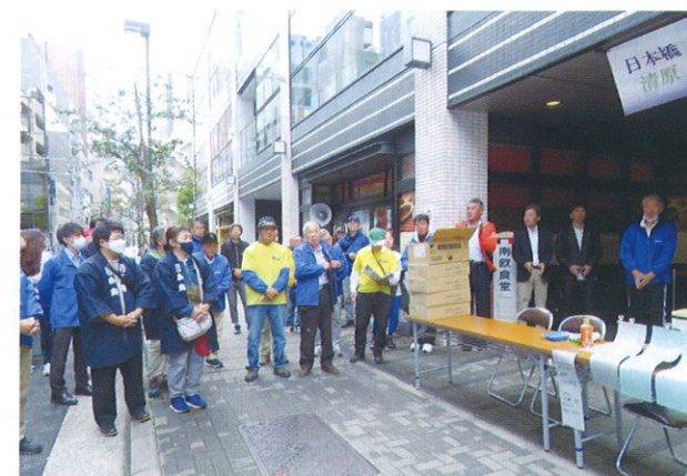
日本橋・清原ふれあいまつり本部テント

10月29日(日)「第5回日本橋・清原ふれあいまつり」が、4年ぶりに日本橋人形町で開催されました。清原地区からはトラック2台とワゴン車一台大型バス一台に分乗し、総勢50名でたくさんの農産物やアユの塩焼き、宇都宮餃子など7つのブースに分かれて販売と交流を行ってきました。日本橋の名物店舗の出店もあり、大変内容の濃いイベントになりました。コロナ禍もありまして、久しぶりの開催となりましたが、各ブース長蛇の列ができるほどたくさんの皆様にご参加いただきました。