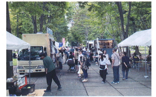
マルシェの賑わい

また、2月24・25日に「きよとこ第2弾」を開催いたしました。これからもLRT沿線まちづくりの地域活性化、発展に結びつく諸活動に取り組んでいきたいと思えますので、清原地域住民の皆さんのご支援ご協力をお願いします。