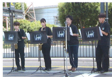
インテグラルmt (星の杜高校) サックス四重奏演奏