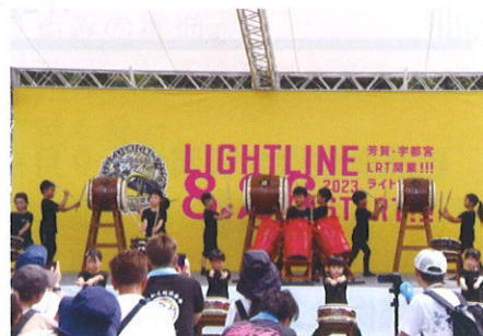
清原和太鼓倶楽部演奏