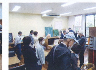
環境保全視察研修会