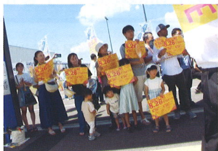
LRT一番列車を歓迎する人々