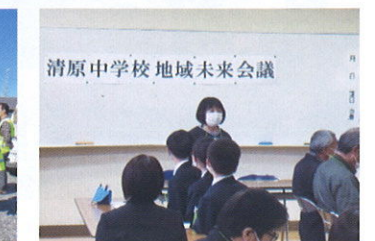
清原中学校未来会議