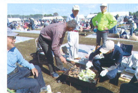
バーベキュー風景