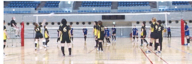
熱戦を繰り広げる両チーム!