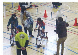
ロードバイク体験