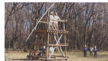
のろし実演の清原中生徒