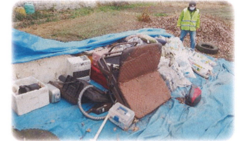
不法投棄パトロール(南部)