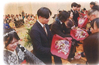
恩師の先生方に感謝を込めて 花束贈呈