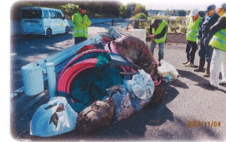
不法投棄パトロール(北部)

令和7年11月4日(火)と12月2日(火)の両日、清原の北部と南部とに渡り、不法投棄パトロールを実施しました。トラック一台分かとも思われる大量の不法投棄物もありました。