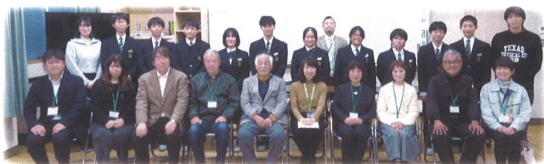
地域の役員・清原中学校生徒会役員・教職員ら24名

令和7年12月18日(木)、清原中学校特別活動室において、清原中学校地域未来会議が開催されました。「マナーについて考える」をテーマに3つのグループに別れ、「自転車」「ライトレール」「公共施設」について、大人と中学生の立場から、それぞれの考えや意見を交換し、地域の未来をつなぐ場となりました。