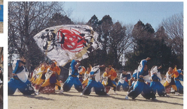
よさこい(Produced by DAIZZY'S凜空)