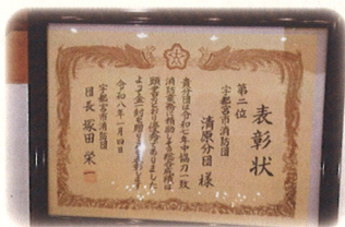
『令和7年度年間優秀分団第2位』賞状