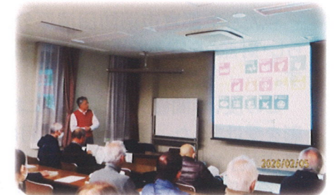
SDGsからカーボンニュートラルへ