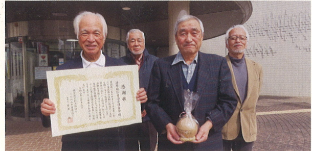
清原地区自治会連合会様

令和8年2月13日(金)、『うつのみや花火大会20周年記念式典』にて【永年にわたる「うつのみや花火大会」への協賛・支援活動】に対し、感謝状ならびに記念品が授与されました。