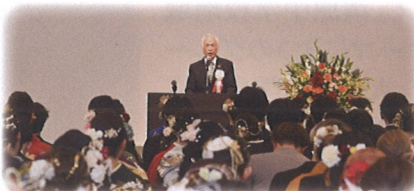
実施委員長あいさつ