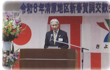
栃木県 福田富一知事 あいさつ